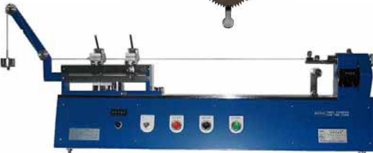
型式 : TT