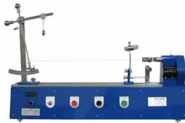
型式 : C